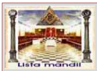
Lista [Mandil] mandil@elistas.net