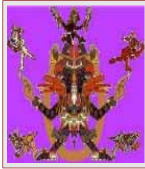
Distinguidos con el Premio Quetzacoatl a la calidad y contenido, otorgado por Pedro Antonio Canseco : .