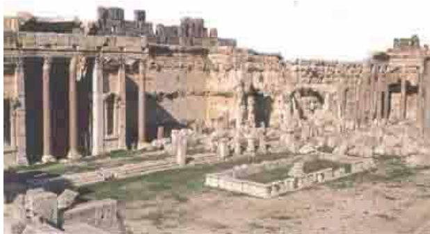
Templo de Júpiter