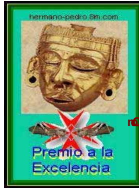
Con el apoyo difusional del Premio «Xipe Totec» del «hermano pedro»