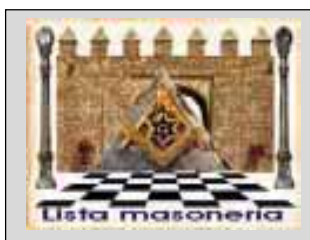
Lista [Masonería] masoneria@eListas.net