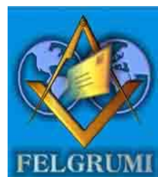
Federación de Listas Masónicas en Internet