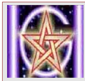
[Humanidad Global] para [Humanitas]